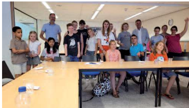
Leerlingen van de Resonans-scholen gaven input voor het nieuwe strategische plan.